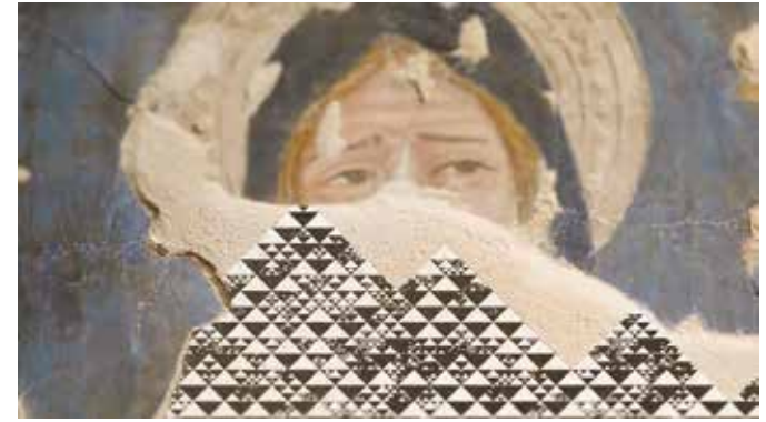
AL RITMO DELL'OMBRA di Bill Denbrough, Brisilda Gjashi, Sibilla Pinocchio - 12', Italia 2018