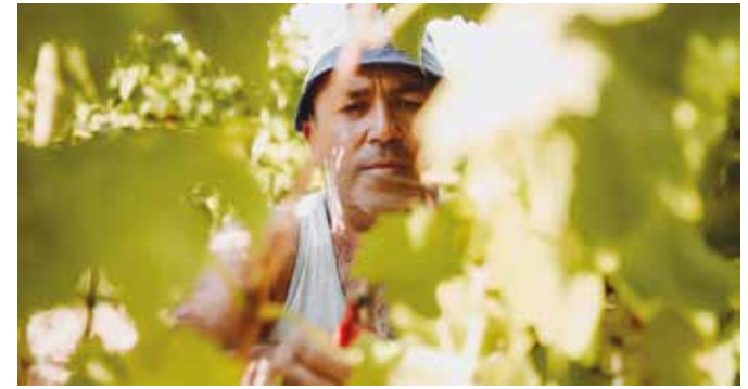
PIGNOLETTA - UN VINO SINCERO di Alexis Ftakas, Giacomo Helferich Volha Lotchanka, Letizia Tonolini - 12', Italia 2018

Proiezione dei corti sulla Valsamoggia realizzati dai partecipanti al corso di formazione legato al festival: